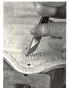
Altüberliefertes Handwerk, S. 62