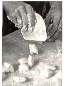
Drei-Gang-Menü zum Nachkochen, S. 73