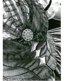
Trachten: Ausserrhoder Kulturgut, S. 62