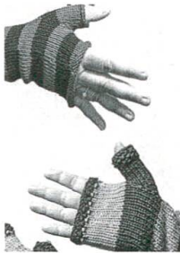
Fingerlose Handschuhe, S. 67