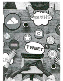
So funktionieren Facebook, Twitter und Co., S. 73