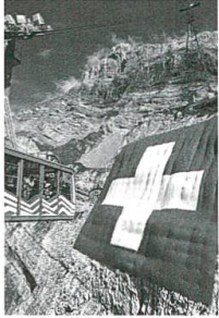
Grösste Schweizerfahne, S. 54