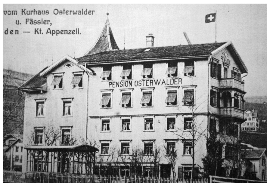
Verschwunden ist auch die ab 1930 von der legendären Naturheilerin Petronella d'Acerno alias «Pagliano-Tante» geführte Pension Osterwalder.

Trotzdem aber blieb und bleibt für Heiden der Tourismus wichtig, und bedeutende Meilensteine auf dem Weg in die diesbezügliche Zukunft waren in der jüngeren Vergangenheit der Neubau des Kursaals und des Hotels Heiden sowie die in mehreren Etappen erfolgte Modernisierung des Heilbades Unterrechstien. Überdies sind derzeit Erneuerungen im Bereich der Hotels «Park» und «Nord» geplant. Bereits im Entstehen begriffen ist das neue, verschiedene Lokalitäten und eine Tiefgarage aufweisende Panoramarestaurant «Fernsicht» an der Seeallee, dessen Eröffnung im Jahre 2015 erfolgt.