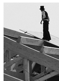
Hermann Blumer erfand das BSB- Verbindungssystem.