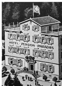
Hotel «Paradies» in Heiden.