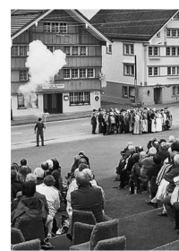
Das Festspiel «Der dreizehnte Ort» in Hundwil.