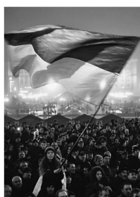
Demonstrationen gegen die Regie- rung in Kiew.