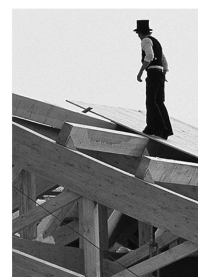
Hermann Blumer erfand das BSB-Verbindungssystem.