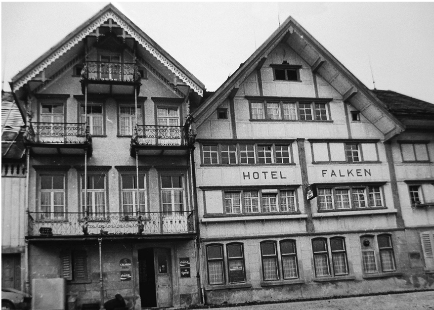
Gemäss der von Pfarrer Sutermeister anonym verfassten Broschüre soll der Dorfkaiser im damaligen Hotel «Falken» (1985 abgebrochen) im Brand, Lachen-Walzenhausen, residiert haben.

Verlag «Gute Schriften» erschien. Obwohl anonym geblieben, eruierte die Einwohnerschaft rasch ihren Pfarrer als Urheber. Bald war auch klar, dass mit «Hubelwies» Walzenhausen und mit «Hinterforst» der Ortsteil Lachen gemeint waren. Und dass die halbe Schweiz mit den Fingern spöttisch auf das dem verwerflichen Lotteriespiel verfallene Walzenhausen zeigte, wurde als grosse Schmach empfunden.