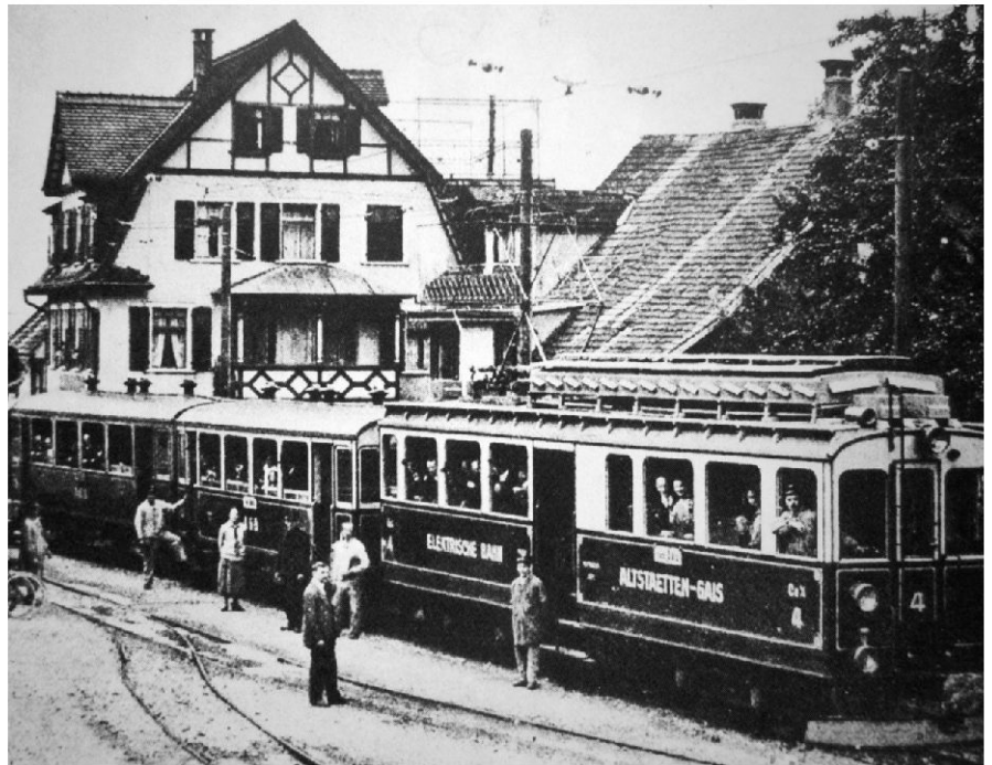
Die Gais-Altstätten-Bahn (hier ein Zug beim Stadtbahnhof in Altstätten) wurde am 17. November 1911 festlich eröffnet.

Mit dem Ausbruch des Ersten Weltkriegs (1914) verschwanden die Vorderländer Bahnprojekte endgültig in tiefen Schubladen. Ab 1920 gelangten ab Heiden mit gutem Erfolg Postautos auf verschiedenen Linien zum Einsatz, und diesbezüglich gute Erfahrungen hatte man mit dem bereits 1906 eröffneten Automobilkurs Rheineck–Lutzenberg–Wolfhalden–Heiden gemacht. Der Siegeszug der Postautos war nicht mehr aufzuhalten, womit die Pläne für neue Appenzeller Bahnlinien endgültig vom Tisch waren. Auch die Säntisbahn musste letztendlich schweren Herzens auf eine Weiterführung ab Wasserauen in Richtung Alpstein verzichten, nachdem 1935 die Luftseilbahn Schwägalp–Säntis Wirklichkeit geworden war.