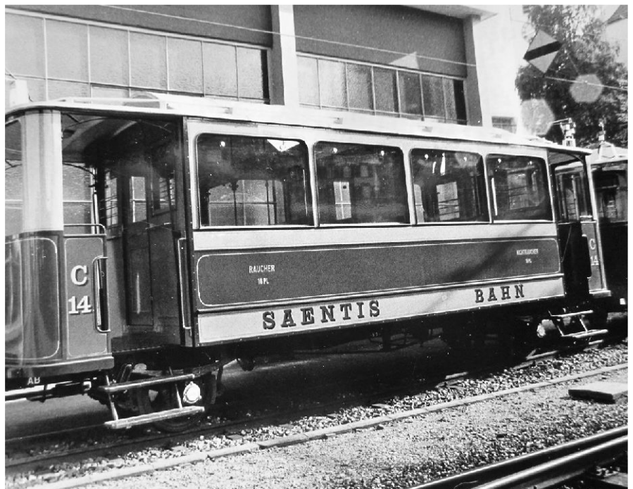
1912 wurde die von Appenzell bis Wasserauen führende Säntisbahn eröffnet. Geplant war eine Weiterführung auf den Säntis, und noch lange nach der Eröffnung der Säntis-Luftseilbahn (1935) trugen die Waggons stolz die Aufschrift «Saentis-Bahn».