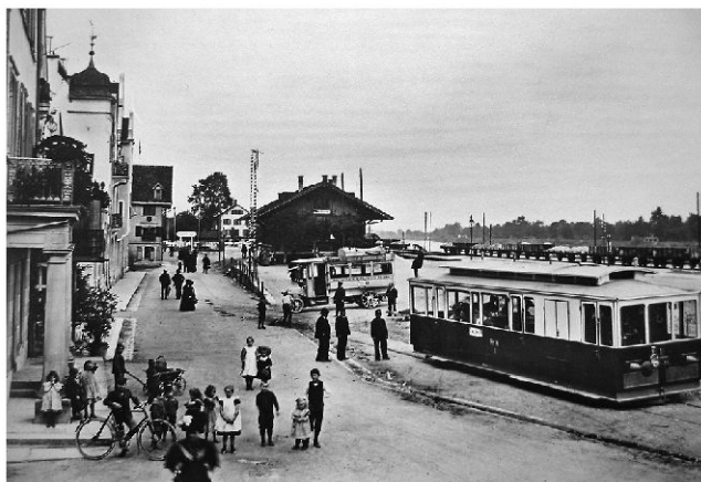
Tram der RhW beim Bahnhof Rheineck. Im Hintergrund der Wagen des bereits 1906 eröffneten Automobilkurses Rheineck–Lutzenberg–Wolfhalden–Heiden.

Die ausschliesslich mit dem Gewicht von Wasser in Bewegung gesetzte Standseilbahn Rheineck–Walzenhausen (RhW) hatte die Talstation gezwungenermassen am Fusse des Berges zu erstellen. Dadurch waren die Passagiere gezwungen, den fast einen Kilometer langen Weg zum Bahnhof Rheineck zu Fuss oder mittels aufgebotenen Fuhrwerk zurückzulegen. Der als unhaltbar empfundene Zustände führte 1909 zum Bau einer die RhW-Talstation mit dem heutigen SBB-Bahnhof verbindenden Trambahn. Am 2. Oktober 1909 wurde ein mit Benzin betriebener Tramwagen seiner Bestimmung übergeben. Um bei Pannen gewappnet zu sein, setzte die RhW Anfang 1910 einen zweiten, mit Strom betriebenen Tramwagen ein. Allerdings kam es immer wieder vor, dass beide Trams ihren Dienst versagten. Der Umbau der RhW im Jahre 1958 führte zu einer direkten Linie Walzenhausen bis Rhein-