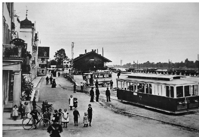
Tram der RhW beim Bahnhof Rheineck. Im Hintergrund der Wagen des bereits 1906 eröffneten Automobilkurses Rheineck–Lutzenberg–Wolfhalden–Heiden.

Die ausschliesslich mit dem Gewicht von Wasser in Bewegung gesetzte Standseilbahn Rheineck–Walzenhausen (RhW) hatte die Talstation gezwungenermassen am Fusse des Berges zu erstellen. Dadurch waren die Passagiere gezwungen, den fast einen Kilometer langen Weg zum Bahnhof Rheineck zu Fuss oder mittels aufgebotenen Fuhrwerk zurückzulegen. Der als unhaltbar empfundene Zustände führte 1909 zum Bau einer die RhW-Talstation mit dem heutigen SBB-Bahnhof verbindenden Trambahn. Am 2. Oktober 1909 wurde ein mit Benzin betriebener Tramwagen seiner Bestimmung übergeben. Um bei Pannen gewappnet zu sein, setzte die RhW Anfang 1910 einen zweiten, mit Strom betriebenen Tramwagen ein. Allerdings kam es immer wieder vor, dass beide Trams ihren Dienst versagten. Der Umbau der RhW im Jahre 1958 führte zu einer direkten Linie Walzenhausen bis Rhein-