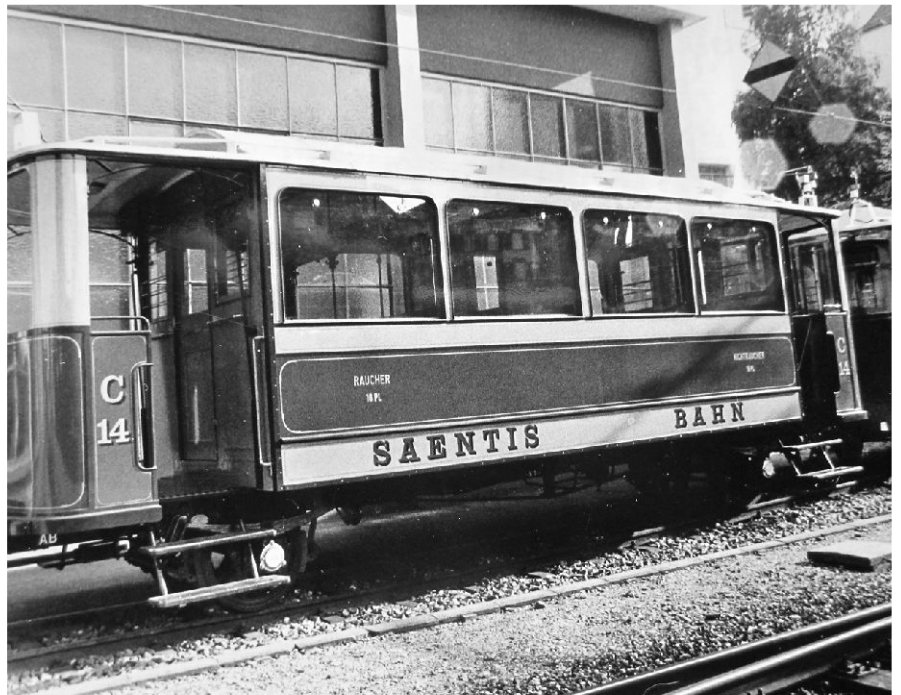
1912 wurde die von Appenzell bis Wasserauen führende Säntisbahn eröffnet. Geplant war eine Weiterführung auf den Säntis, und noch lange nach der Eröffnung der Säntis-Luftseilbahn (1935) trugen die Waggons stolz die Aufschrift «Saentis-Bahn».