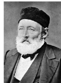
Carl Friedrich Frölich, Erstbesteiger des Altmanns