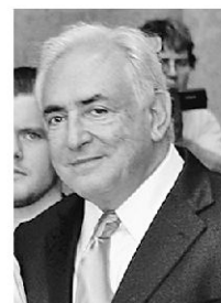
Affäre um IWF- Direktor Dominique Strauss-Kahn