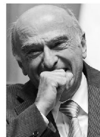
Ende einer Bundes- ratskarriere: Hans-Rudolf Merz