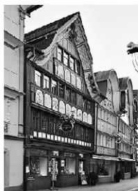
Appenzell: Lebendiger Flecken