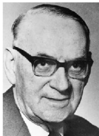
Appenzeller Humanist: Carl Lutz