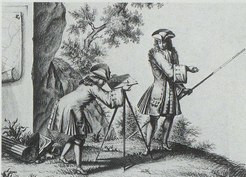
Vermesser an der Arbeit mit Messtisch und Messstange, 18. Jahrhundert.

Der erwähnte Hof Schochenberg verzeichnete im frühen 17. Jahrhundert wiederholt Jahre