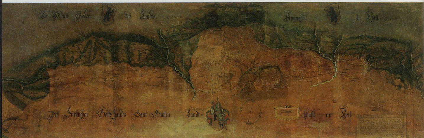
Die 1637/38 von Hans Conrad Gyger geschaffene Karte mit den gestrichelten Grenzverläufen im Norden von Herisau.

ten, unterschiedlichen Grenzverläufe. Auf der Federzeichnung sind es kaum mehr erkennbare gelbe Linien.