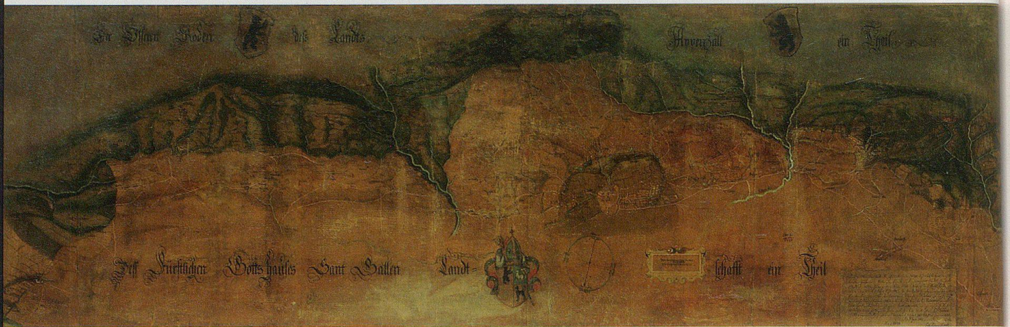
Die 1637/38 von Hans Conrad Gyger geschaffene Karte mit den gestrichelten Grenzverläufen im Norden von Herisau.

ten, unterschiedlichen Grenzverläufe. Auf der Federzeichnung sind es kaum mehr erkennbare gelbe Linien.