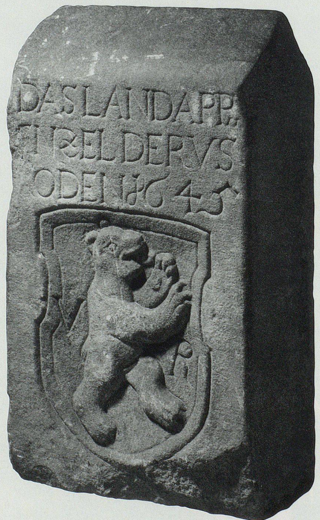
Der 1645 zugehauene und 1652 gesetzte Grenzstein. Er stand vermutlich im Gebiet Chalchofen bei Herisau.

Die Sonderausstellung «Vermessenes Appenzellerland – Grenzen erkennen» gab den Anlass, sich mit der Vergangenheit des Grenzsteins zu beschäftigen. Es zeigte sich, dass bei der Interpretation der eingemeisselten