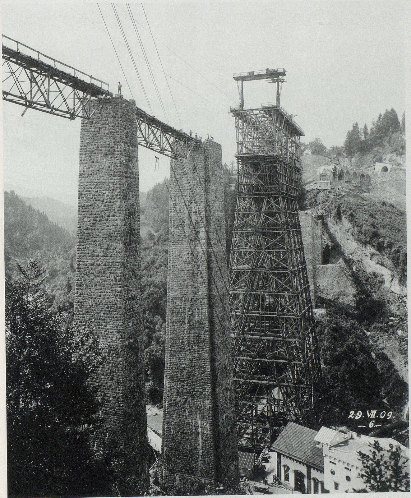
Der Bau des Sittler Viadukts, der höchsten Brücke Europas, in Stein-Eisen-Konstruktion.