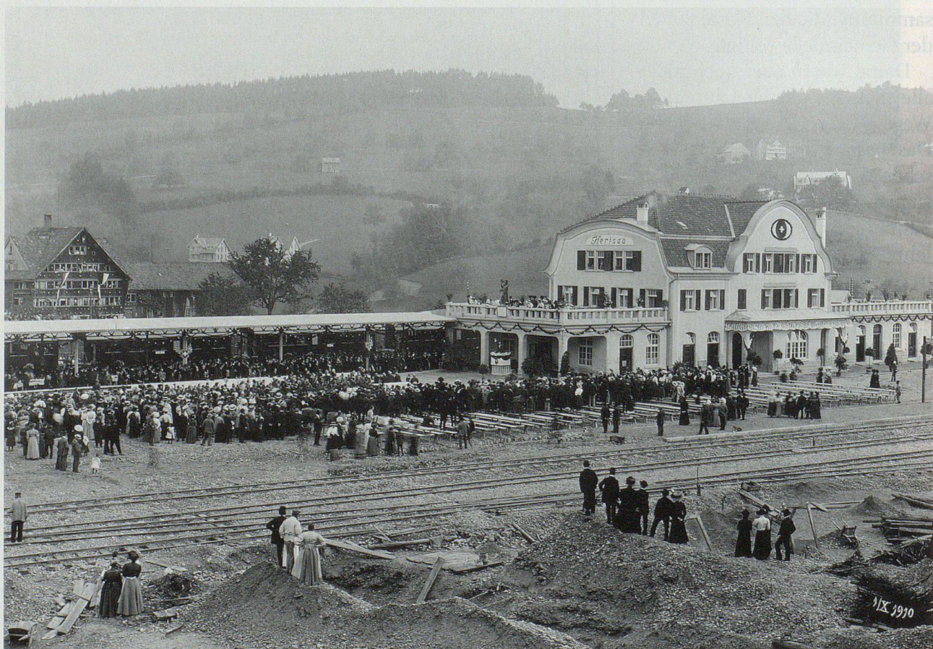
Eine grosse Menschenmenge fand sich am 1. Oktober 1910 beim Bahnhof Herisau ein und begrüßte den Festzug.