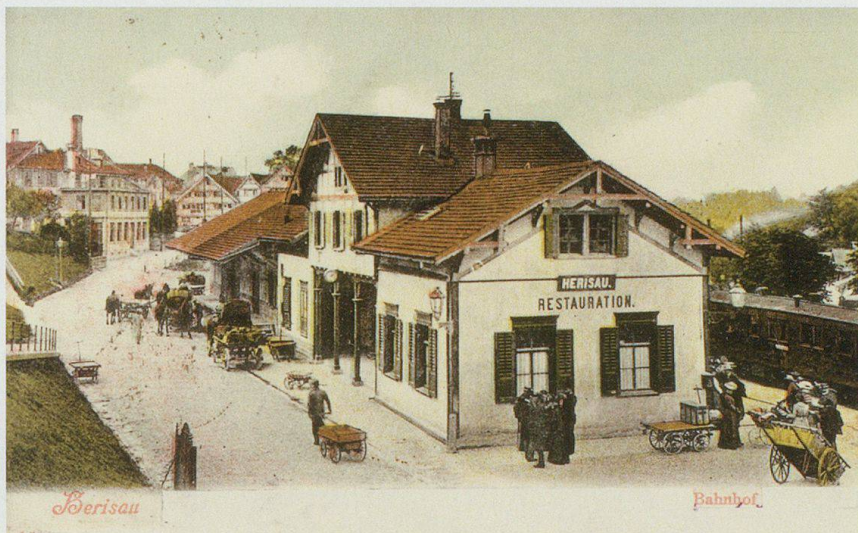
Der dorfnahe Kopfbahnhof der AB an der Bahnhofstrasse in Herisau, ungefähr Höhe heutiges Hotel Herisau, verschwand mit dem Bau der BT zugunsten des Gemeinschaftsbahnhofs.

Die heftige Diskussion der Frage, ob ein Tunnel durch den Ricken oder ob der Schienenweg