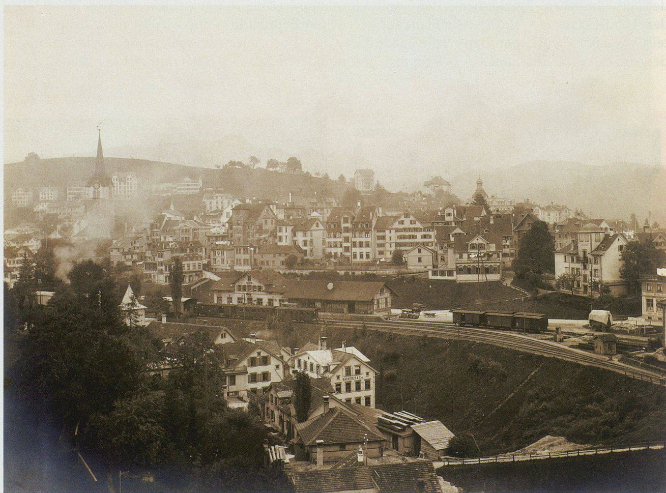
Die Ein- und Ausfahrt in die zentrumsnahe Station Herisau der Appenzeller Bahn geschah über das gleiche, von rechts kommende Gleis. Richtung Urnäsch–Appenzell fahrende Züge wurden zur Abzweigstelle zurückgeschoben.

heutigen Standort in BT-Nachbarschaft verlegt und die Strecke nach Winkeln verschwand zugunsten der Verbindung nach Gossau. Doch blicken wir angesichts des Jubiläums «100 Jahre BT (1910 bis 2010)» zurück – und insbesondere auch auf das Seilziehen um den Bahnhof Herisau.