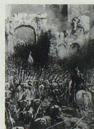
Erstürmung von Solferino