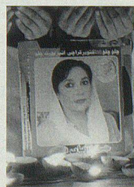
Anschlag auf Benazir Bhutto