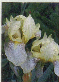
Kulturgeschichte der Schwertlilie