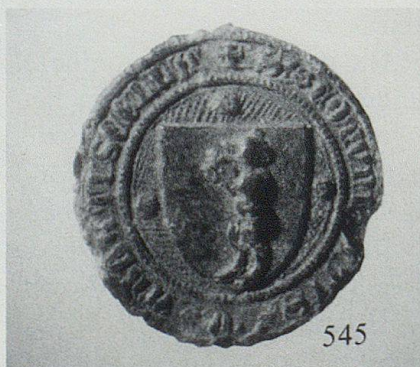
Das älteste Siegel des Landes Appenzell hängt an den im Bayerischen Hauptstaatsarchiv in München aufbewahrten Städtebundsurskunden vom 4. Juli 1379 und trägt die Umschrift S(IGILLUM) COMUNITATIS IN ABBATISCELLA.

Viele Städte um den See waren in ein gleichsam übergeordnetes System von Bündnissen eingebunden, dem St. Gallen wie Konstanz schon früh angehörten und in das wenige Jahrzehnte vor den so genannten Appenzeller Freiheitskriegen die Appenzeller aufgenommen wurden.