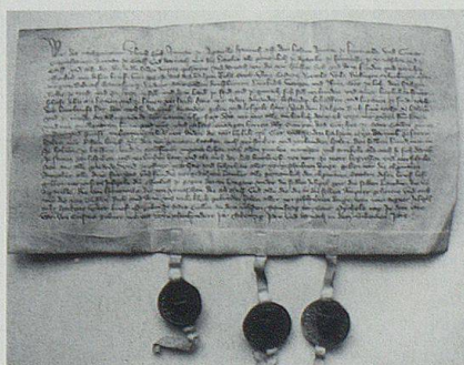
Am 26. September 1377 verbündeten sich die Ländlein Appenzell, Hundwil, Urnäsch, Gais und Teufen mit 15 schwäbischen Reichsstädten, darunter mit St. Gallen. Die Urkunde befindet sich im Stadtarchiv St. Gallen.

Der Städtebund legte in dieser Urkunde unmissverständlich die Voraussetzungen fest, welche die neu Aufzunehmenden erfüllen mussten. Dabei orientierte er sich an seinen Massstäben, was die Forderung nach einem Gremium von 13 Männern zeigt. In den Städten waren es nämlich die Räte, welche die Stadt gegen innen und aussen vertraten. Diese, oder besser gesagt Abordnungen von ihnen, waren die Ansprechpartner an den «Bundestagen», das heisst an den Zusammenkünften der verbündeten Städte. Sie hatten auch dafür zu