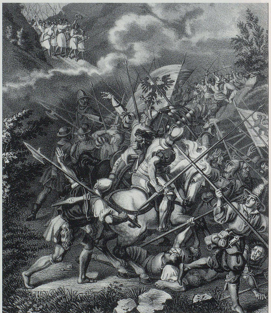
Darstellung der Schlacht am Stoss aus der Chronik von Benedikt Tschachtlan (zweite Hälfte 15. Jahrhundert).

Den Österreichern folgten die Eidgenossen. Die Ostschweiz