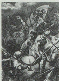
Die Appenzeller Freiheitskriege