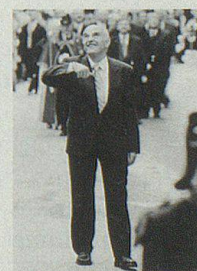
Bundesrat Hans- Rudolf Merz