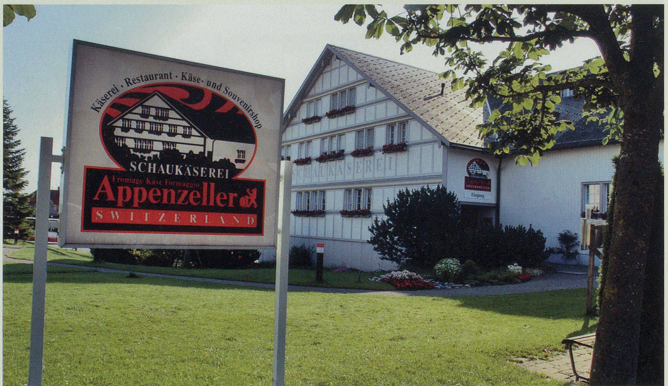
Die Schaukäserei – eine Touristenattraktion.

Weitere Informationen erhalten Sie bei: Appenzellerland Tourismus AR, 9410 Heiden Telefon Nr. +41 71 898 33 00, Homepage: www.appenzell.ch E-Mail: info.ar@appenzell.ch