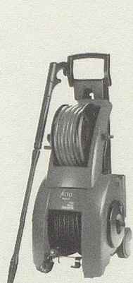
Moderne Hochdruckreiniger für Haus/Garten/Hobby