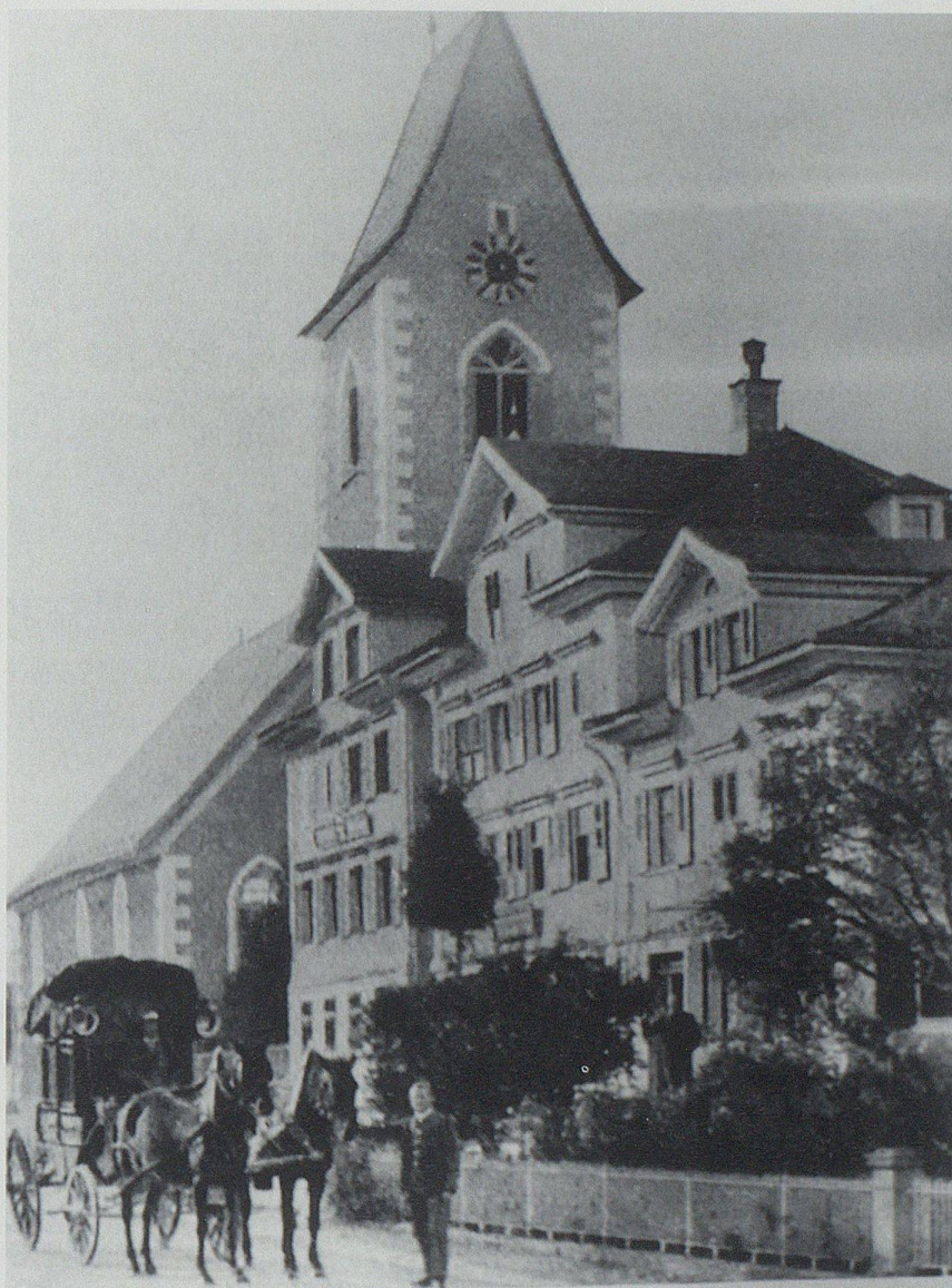
Das Wolfhändler Postbüro befand sich damals unweit der Kirche im Anbau der Drogerie (ganz rechts). Die Postkutsche sorgte in jenen Jahren für regelmässige Verbindungen nach Rheineck und Heiden.