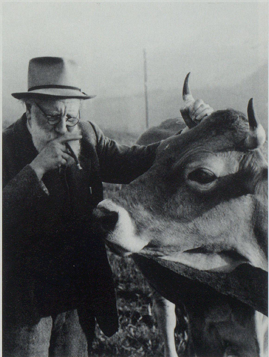
Albert Servaes zu Besuch im Appenzellerland, um 1950.

Sein expressionistisch-schockierender Stil hat zur Folge, dass ihn die katholische Amtskirche 1921 auf den Index setzt und viele seiner Werke aus den Kirchen entfernt werden. 2