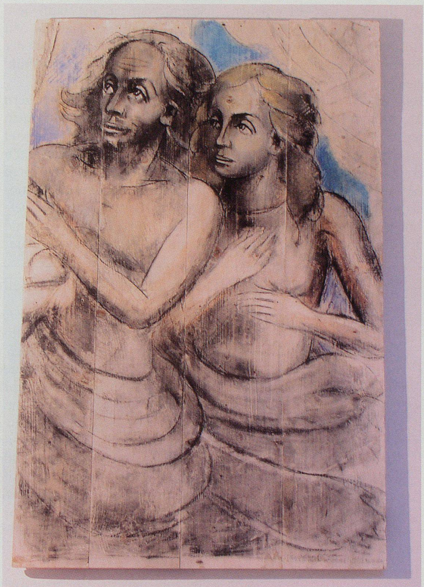
Adam und Eva, Vertreibung aus dem Paradies? (Kreide und Kohle) 1945.