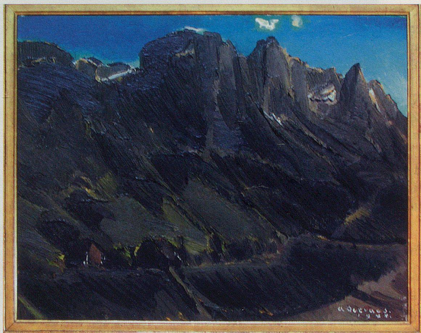
Wissbachtal mit Ebenalp, Schäfler, Säntis und Öhrli, 1948 (Privatbesitz Winterthur).