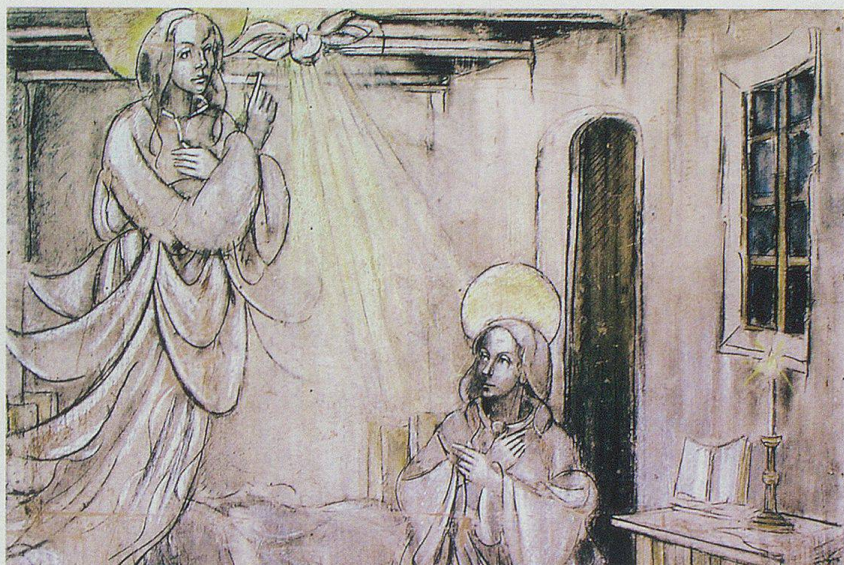
Annunciación oder Mariä Verkündigung, (Kreide und Kohle) 1945.