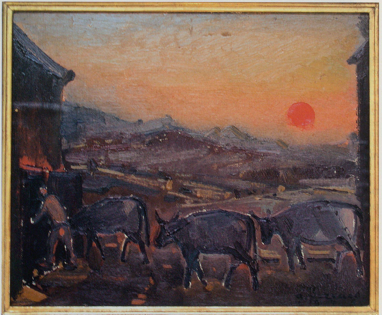
Goldener Sonnenuntergang, Öl. 1945 (Privatbesitz Appenzell).

Gegen Ende des Zweiten Weltkriegs kommt Servaes politisch unter Druck. Er ist ein Anhänger der flämischen Nationalbewegung, die teilweise in Verbindung zur besatzernahen deutsch-flämischen Arbeitsgemeinschaft (DEVLAG) steht. 1944 gerät er in die Mühle der kompromisslosen Gegenbewegung, die das Ziel verfolgt «détruire tout ce qui était inspiré, directement ou indirectement, par le nationalisme