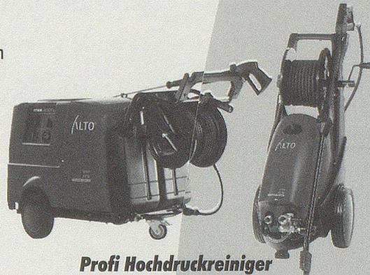
Profi Hochdruckreiniger für Kalt- und Warmwasserbetrieb