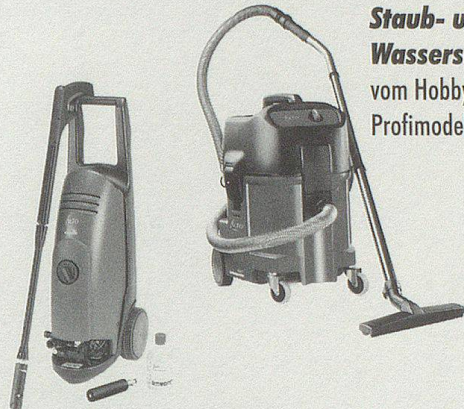
Staub- und Wassersauger vom Hobby- bis zum Profimodell