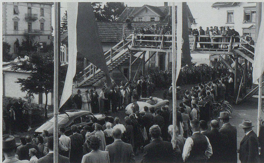
Zu jedem Autorennen gehörte die aus Holz erstellte Fussgängerüberführung, die im Walzenhauser Dorfzentrum während des Rennbetriebs den Zugang zum Bahnhof und zum Hotel Kurhaus-Bad ermöglichte.

rophe im französischen Le Mans im Jahre 1955 führte zu einem sofortigen Verbot des Rundstreckenrennens in Bremgarten BE und auch des Auto-Bergrennens in Walzenhausen.