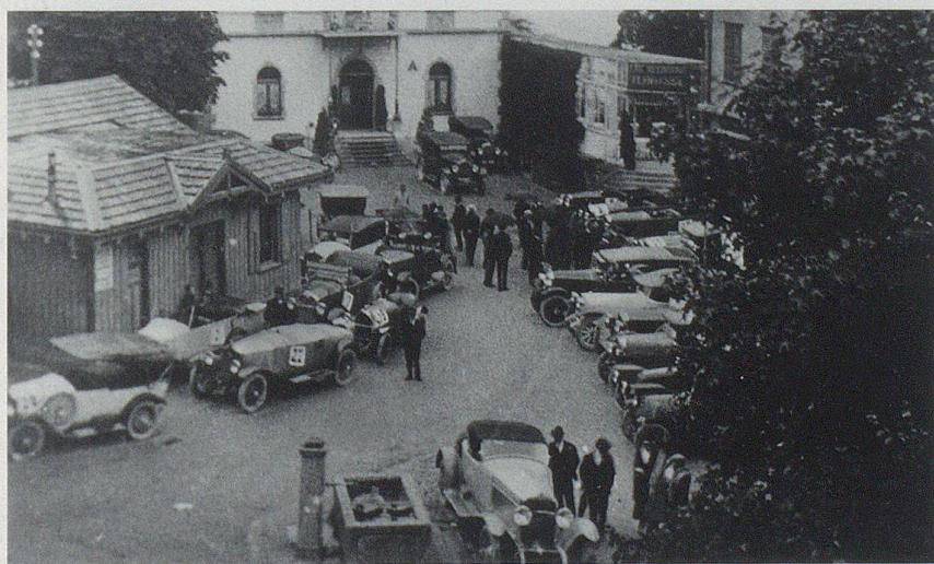
Das Autorennen in den 1920er-Jahren: Nach dem Rennen wurden die Wagen rund um das alte Bahnhofgebäude von Walzenhausen (links) parkiert, weil im Hotel Kurhaus-Bad (hinten) die mit Spannung verfolgte Rangverkündigung stattfand.

Mit dem Ausbruch des Zweiten Weltkriegs (1939) war es mit der Austragung des Rennens schlagartig vorbei. Erst 1947 war die