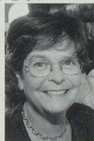
Ex-Bundesrätin Ruth Dreyfuss