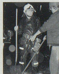
Aufräumarbeiten nach dem grossen Unwetter