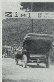
«Automobil- Wettrennen Alt- stätten-Ruppen»