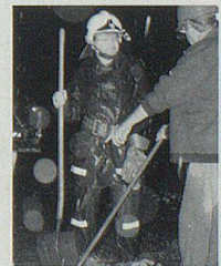
Aufräumarbeiten nach dem grossen Unwetter