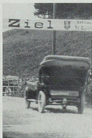
«Automobil- Wettrennen Alt- stätten–Ruppen»