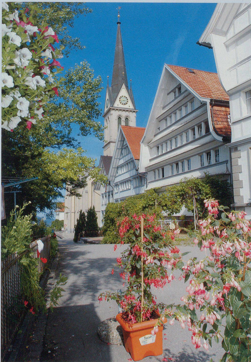
Dorfansicht mit Kirche.

Der weite, mühsame Weg nach Goldach wurde indes längst schon beklagt. Es ist deshalb so gut wie sicher, dass an den Trogener Bemühungen beim Abt von St. Gallen um eine eigene Kirche auch die Einwohnerschaft des heutigen Rehetobels und von Wald mitbeteiligt war. Der