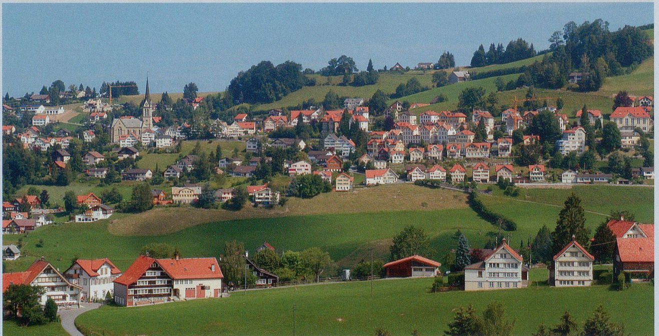
Ansicht vom Standort Wald.