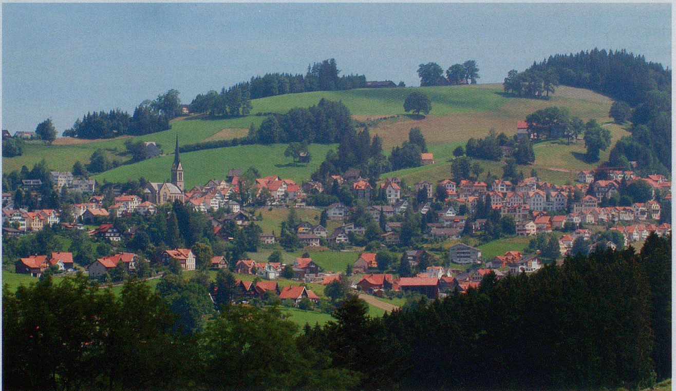
Rehetobel Ansicht von Trogen aus.

In einem durch die Eidgenossen gefällten Schiedsspruch, 1458, wurde die Grenze etwas enger gezogen, die Zugehörigkeit Rehetobels zum Lande Appenzell formell geregelt, nicht aber die kirchliche Zugehörigkeit.