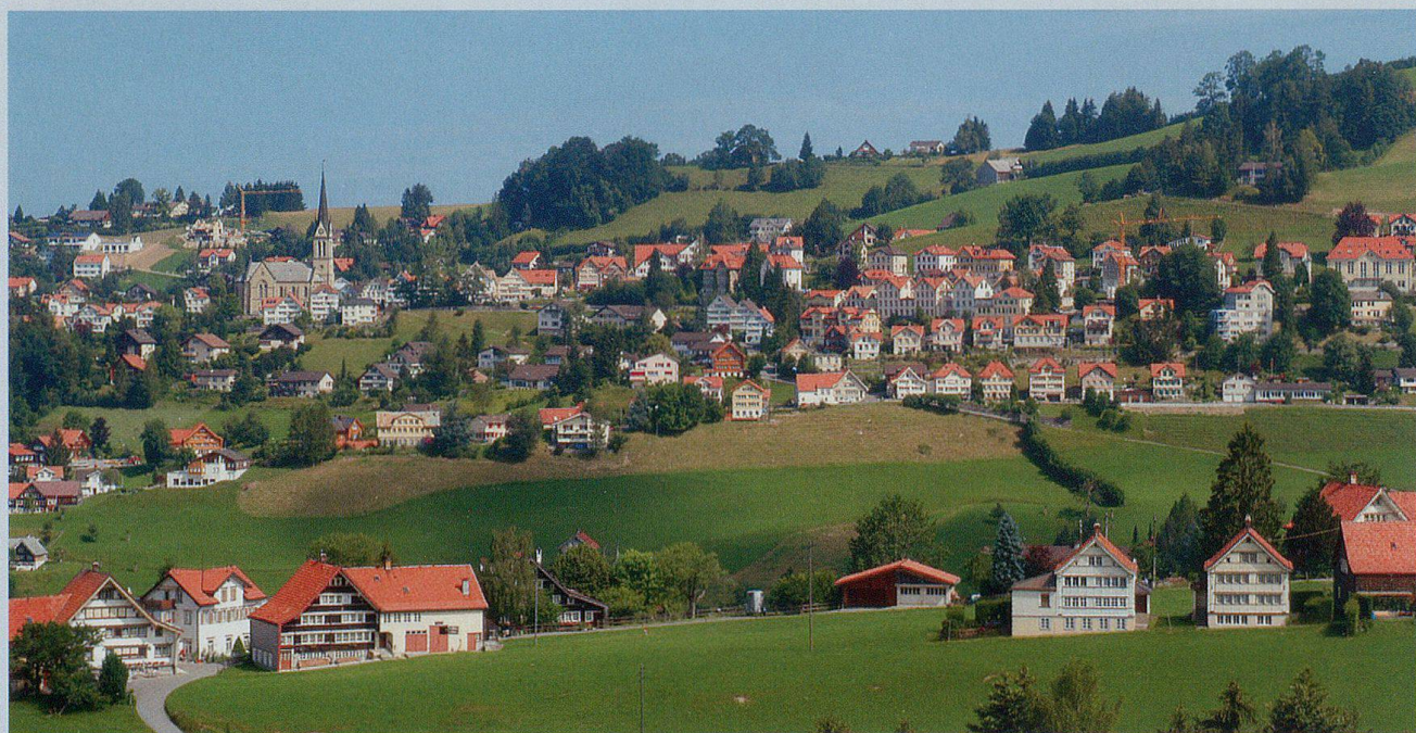
Ansicht vom Standort Wald.