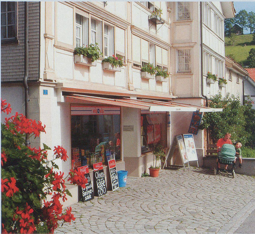
Einkaufen im Dorf.

zu je gleichen Teilen auf die Betriebe in Rehetobel (Geschäftssitz) und Berneck. Mit steigendem Exportanteil ist die Firma auch international führend in der Herstellung von Spezialprodukten für die elektronische Industrie.