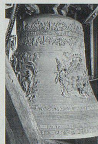
«Grosse Glocke», Herisau