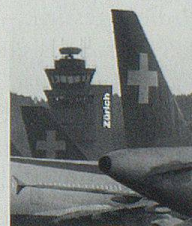
Untergang der Swissair