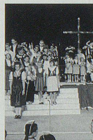
Kantonaltage an der Expo