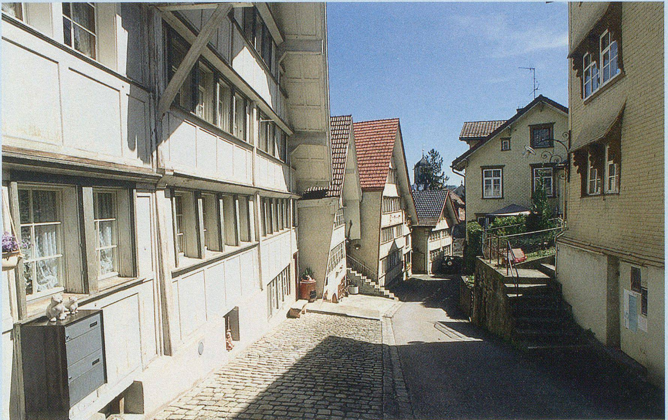
Hinunter durchs Oberdorf zum Landsgemeindeplatz.

Vereine und Veranstaltungen, Schule und Pestalozzidorf, Architektur und Natur verleihen Trogen – dem Kulturdorf im Appenzellerland – sein eigenes, spezielles Gesicht.