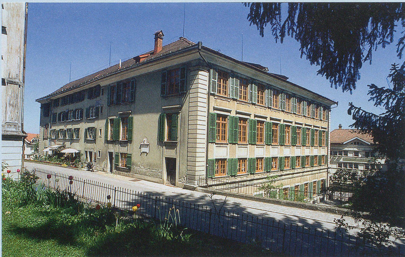
Der Fünfeckpalast am Landsgemeindeplatz.

durch die Fassade der barocken Grubenmann-Kirche von 1782 und andererseits gesäumt von Steinpalästen der Zellwegerdynastie.