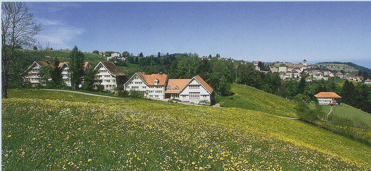
Heim Neuschwende mit Trogen im Hintergrund.

Nach der Verlagerung des Verwaltungszentrums ab dem 19. Jahrhundert nach Herisau ist Trogen heute noch Sitz der Gerichts- und Polizeibehörden. Damit hat Trogen die meisten Arbeitsplätze im Dienstleistungssektor anzubieten, aber auch zahlreiche Gewerbebetriebe sind in Trogen vertreten. Die Weiler sind noch stark landwirtschaftlich geprägt.