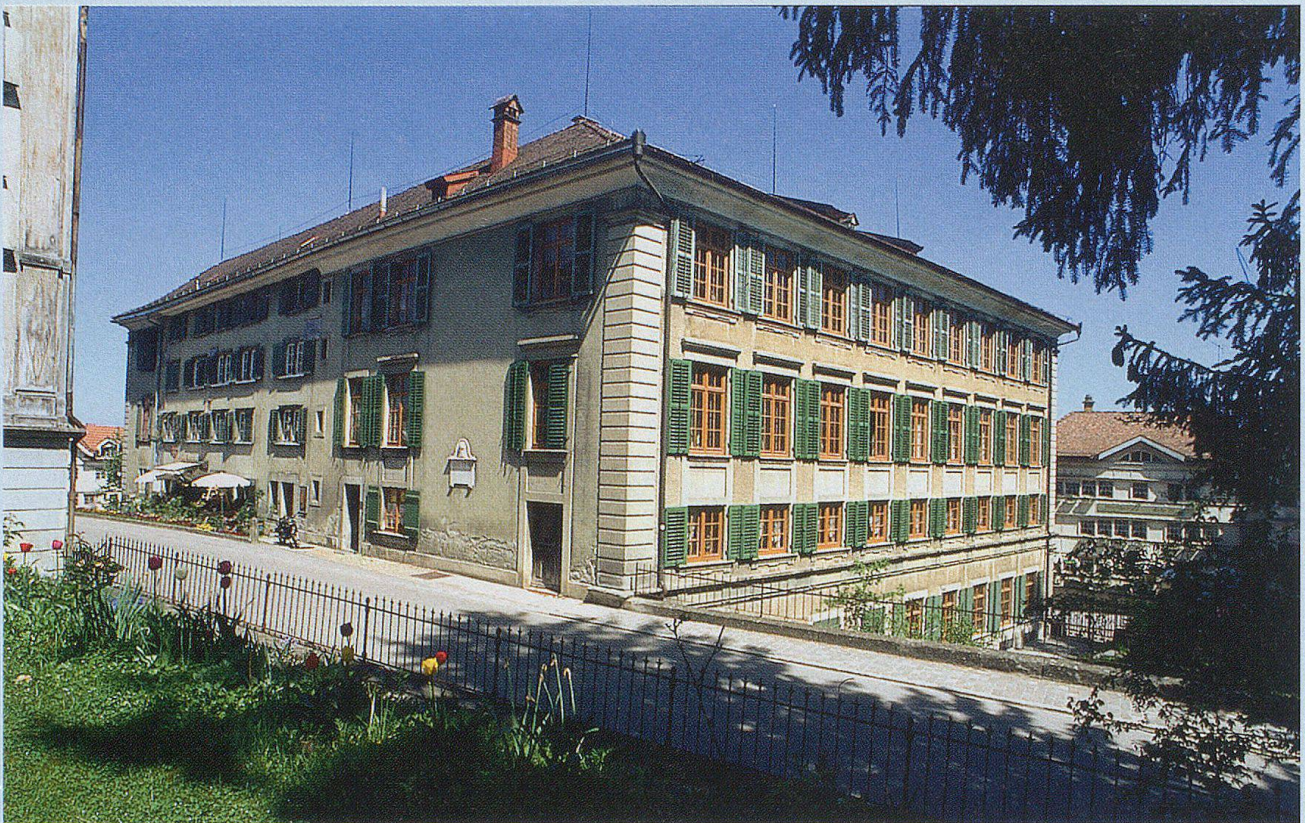
Der Fünfeckpalast am Landsgemeindeplatz.

durch die Fassade der barocken Grubenmann-Kirche von 1782 und andererseits gesäumt von Steinpalästen der Zellwegerdynastie.