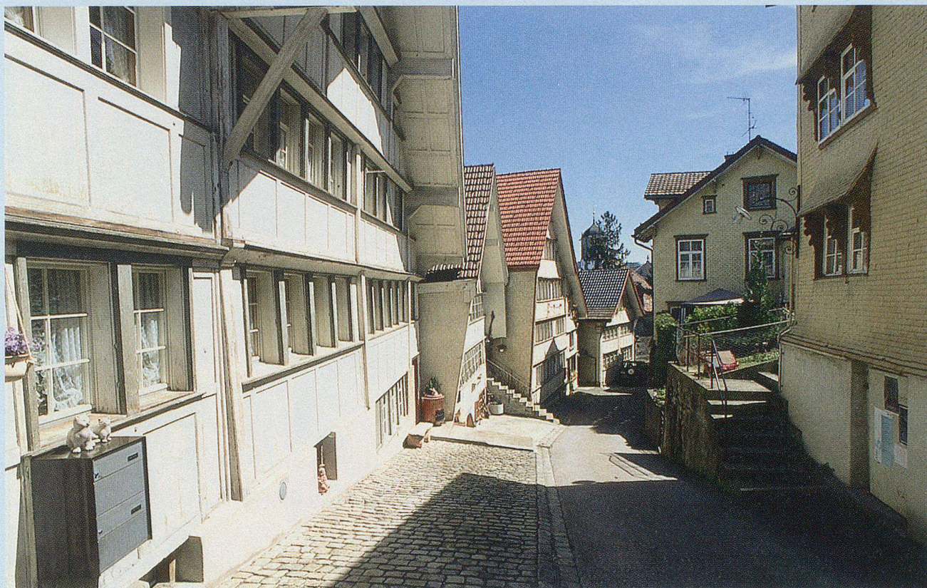
Hinunter durchs Oberdorf zum Landsgemeindeplatz.

Vereine und Veranstaltungen, Schule und Pestalozzidorf, Architektur und Natur verleihen Trogen – dem Kulturdorf im Appenzellerland – sein eigenes, spezielles Gesicht.