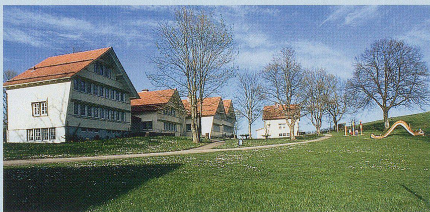
Häusergruppe des Pestalozzidorfs.