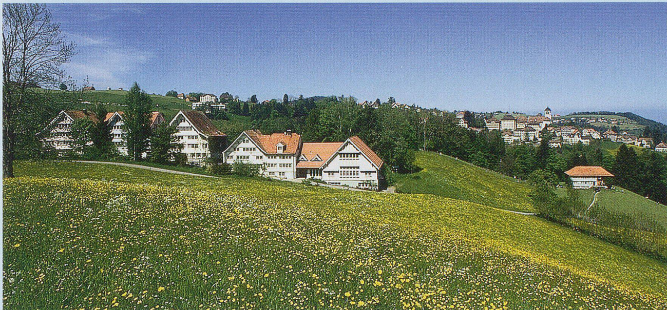
Heim Neuschwende mit Trogen im Hintergrund.

Nach der Verlagerung des Verwaltungszentrums ab dem 19. Jahrhundert nach Herisau ist Trogen heute noch Sitz der Gerichts- und Polizeibehörden. Damit hat Trogen die meisten Arbeitsplätze im Dienstleistungssektor anzubieten, aber auch zahlreiche Gewerbebetriebe sind in Trogen vertreten. Die Weiler sind noch stark landwirtschaftlich geprägt.