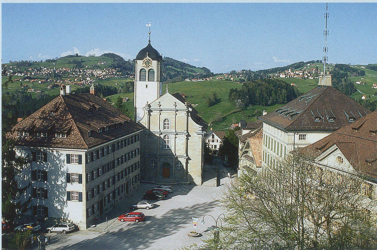
Der Landsgemeindeplatz – bis 1996 Tagungsort der Ausserrhoder Stimmberechtigten.

Trogen, der historische Hauptort in Appenzell Ausserrhoden, liegt hoch über dem linken Ufer der Goldach, am Nordfuss des Gäbris. Obwohl sich das Verwaltungszentrum von Trogen immer mehr nach Herisau verlagerte und heute nur mehr Gerichts- und Polizeibehörden sowie die Kantonsbibliothek und Denkmalpflege ihren Sitz in Trogen haben, legte die neue Aus-