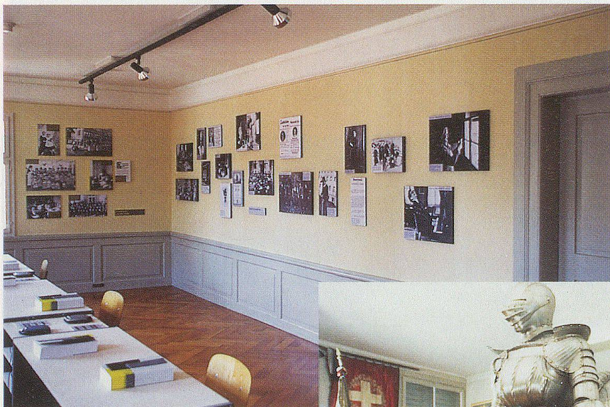
Der ehemalige Lehrsaal (oben) dient seit 1999 für Wechselausstellungen.