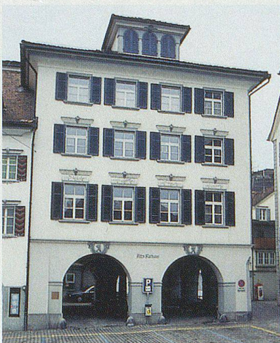
Das alte Herisauer Rathaus am Platz, seit 1967 Museum.

Das Museum Herisau befindet sich an zentraler Lage im alten Rathaus am Platz bei der mächtigen Dorfkirche. Das 1828 vollendete Rathaus steht zwischen dem ehemaligen Pfarrhaus (1606) und dem repräsentativen Wetterhaus (1737). Der dreigeschossige Riegelbau in klassizistischem Baustil erhebt sich über