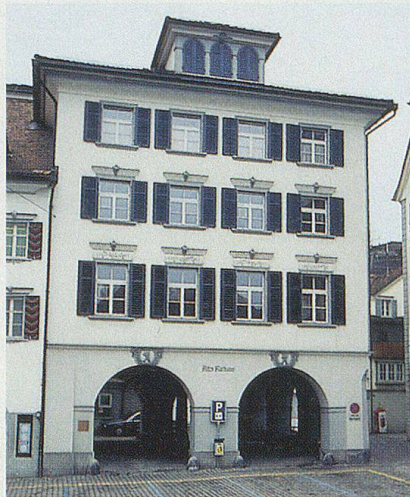
Das alte Herisauer Rathaus am Platz, seit 1967 Museum.

Das Museum Herisau befindet sich an zentraler Lage im alten Rathaus am Platz bei der mächtigen Dorfkirche. Das 1828 vollendete Rathaus steht zwischen dem ehemaligen Pfarrhaus (1606) und dem repräsentativen Wetterhaus (1737). Der dreigeschossige Riegelbau in klassizistischem Baustil erhebt sich über