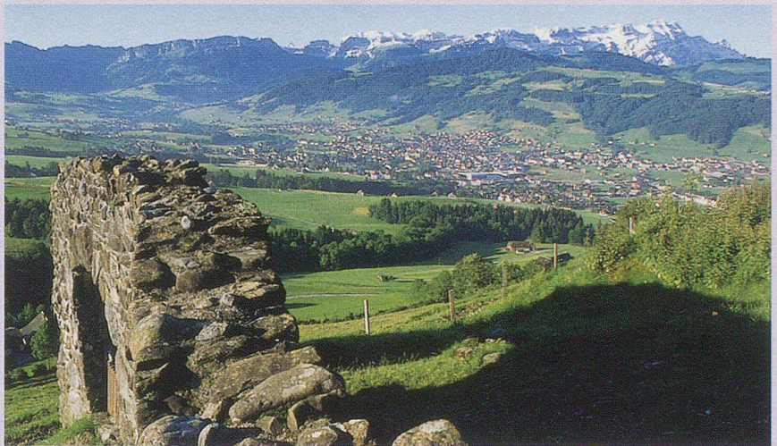
Blick von der Bergruine Clanx aus auf Appenzell und Säntis.