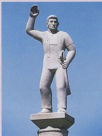
Eidschwörender Landsgemeinde- mann.