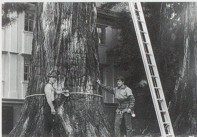
Vielbestaunt werden die beiden Mammutbäume, die einen Umfang von fast 8 Metern aufweisen, vor dem Haus Krüsi, Dorf (vormals Haus von Nationalrat Albert Keller-Aebli).