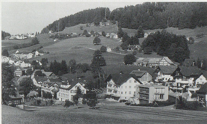
Der über eine eigene Post und Sparkasse verfügende Ortsteil Schachen verzeichnete in den letzten Jahren eine rege Wohnbautätigkeit.