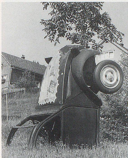
Im Ortsteil Schachen befindet sich ein originelles Denkmal, «Döschwo».