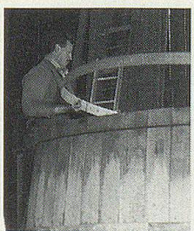
Wie entsteht ein 5000-Liter-Fass?