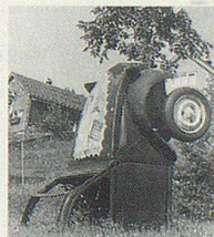
Originelles Denkmal in Reute AR