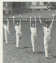
Stramme Turner vom Kollegium Appenzell