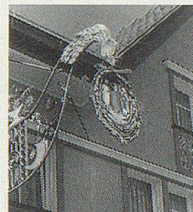
Willkommen in Oberegg AI