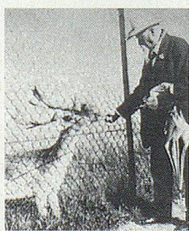
Wildpark Peter und Paul