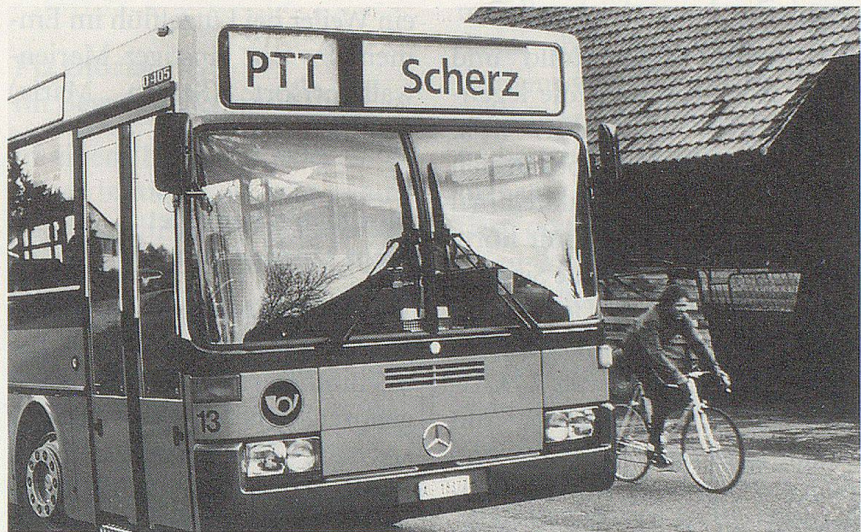
Im Postauto nach Scherz: Das muntere Dorf liegt im Kanton Aargau, wo man offenbar gerne lacht.

Zum Glück wird die Entscheidung darüber, wie ein Dorf oder eine Stadt zu benennen sei, selten den Waffen überlassen. In der dichtbesiedelten Schweiz der Gegenwart gibt es ohnehin kaum