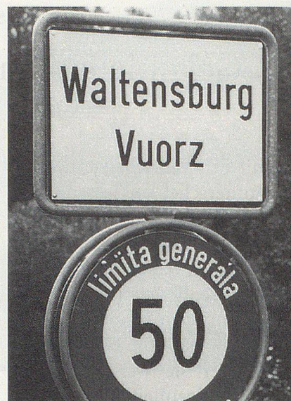
Waltensburg/Vuorz: Die Ortstafel zeigt, dass hier im Bündner Vorderrheintal Deutschsprachige und Rätoromanen zusammenleben.

Vor allem Gewässer- und Bergnamen, die zu den ältesten Bezeichnungen auf der Landkarte gehören, gehen nicht selten auf keltische Zeiten zurück. Dazu zählen Flüsse wie Aare, Rhein und Rhone; sie enthalten die Wortwurzel «ar» oder «ran/ron», was «rinnen» bedeutet. «Mor» hingegen weist auf eine gebirgige Geländeform hin: Damit bezeichneten unsere fernen Vorfahren eine steinige, felsige, geröllreiche Gegend. Morgetenhorn, Morschach und Morcote retten diesen Keltenklang in die Gegenwart hinüber. Auch das Schlachtfeld am Morgarten an der Grenze von Schwyz zu Zug enthält dieses «mor». Tatsächlich wälzten die Eidgenossen an jenem Novembertag des Jahres 1315 grosse Steinblöcke auf das österreichische Ritterheer herunter. Die volkstümliche Deutung der blutigen Stätte als «Mordgarten» kann schon deshalb nicht zutreffen, da ja Morgarten bereits vor der Schlacht so hiess («hütet euch am Morgarten»).