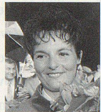
Erste Innerrhoder Regierungsrätin Ruth Metzler