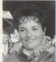
Erste Innerrhoder Regierungsrätin Ruth Metzler