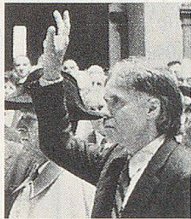
Bundesrat Moritz Leuenberger