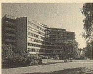
St.Gallen: Stadt im grünen Ring