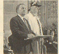
Gedenkanlass 50. Jahrestag des Weltkriegsendes