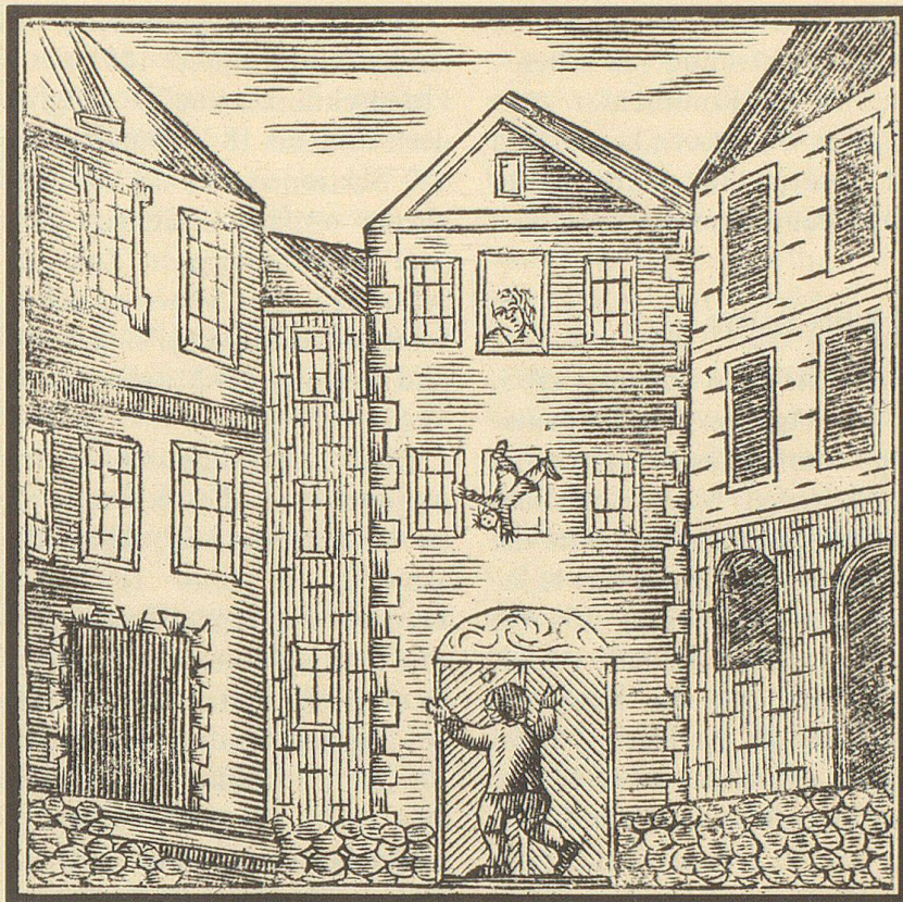
«Der glückliche Tagelöhner».

Ein gutes Herz hatte ein Dorfbewohner. Ein Strumpfweber in