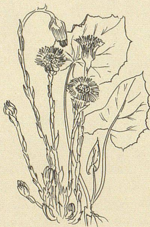
Entlang des Gesundheitswanderwegs sind alle Pflanzen auf Informations-tafeln abgebildet und beschrieben.

stelle Scheidweg (Kaien 967 m über Meer).