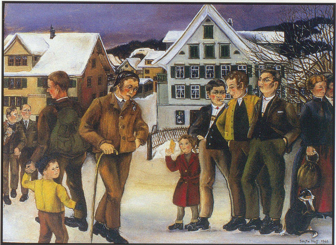
«Schlag und Läuf» – was so läuft und geht am Markt.