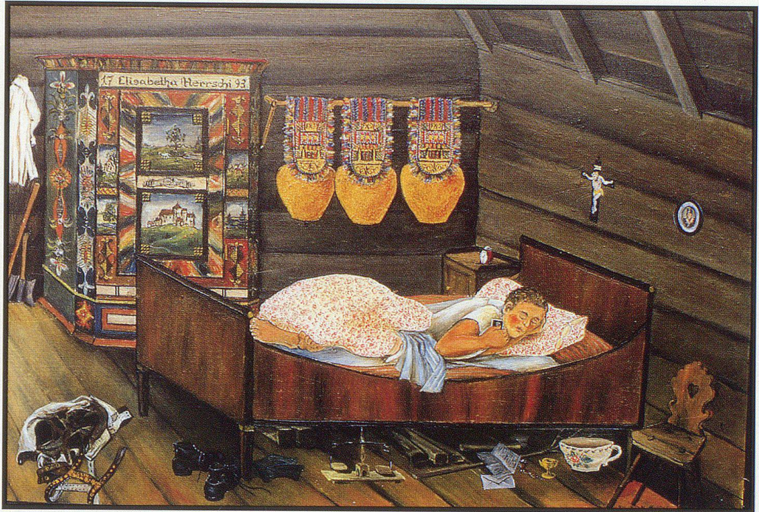
«Das Glück des Einsamen» – Ein Klassiker von Sibylle Neff.