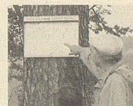
Erster Gesund- heitswanderweg