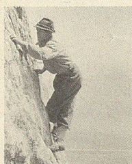
Bergsteiger in den Kreuzbergen