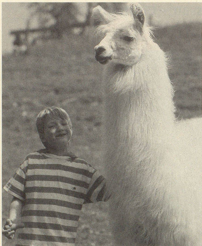
Im Streichelzoo kann das Kind den Bezug zum Tier – hier ein Lama – herstellen.

traktiven Freilaufgehegen – über 500 Tiere in 130 Arten können hier aus nächster Nähe beobachtet werden.