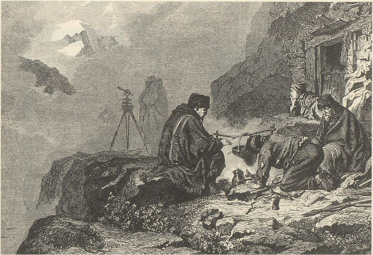
Ohne Mühen keine genauen Karten, einst wie heute: Dieser Holzstich aus der Zeit um 1860 heisst «Topographien im Gebirge».

und werden verdankt, tragen sie doch dazu bei, den anerkannt hohen Standard unserer Landeskarten zu halten.