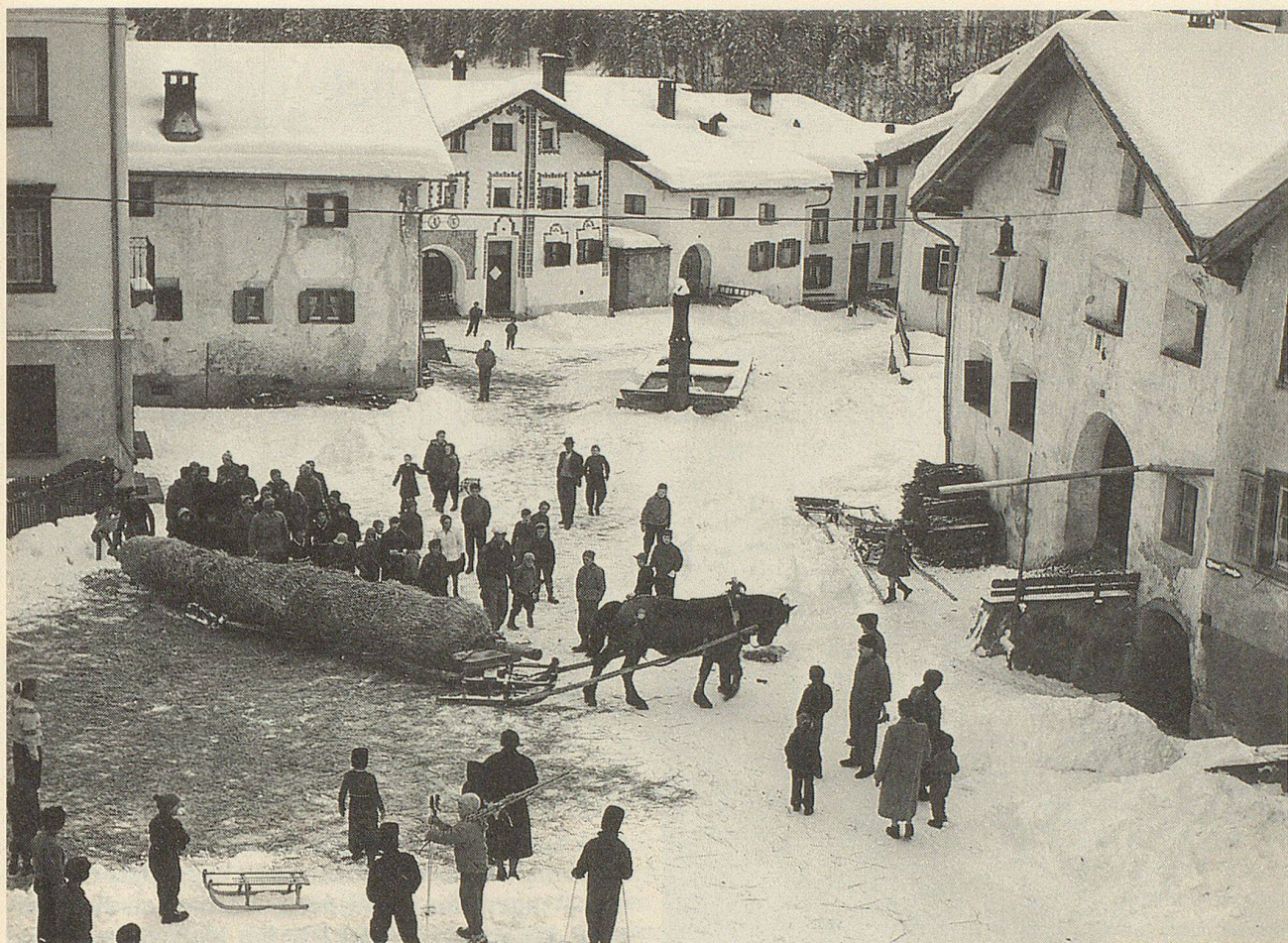
Der Strohmann ist verladen und wird an seinen Standort über dem Dorf geführt, wo er alljährlich am ersten Februar-Sonntag verbrannt wird.

Jung und alt schauen diesem feierlichen Akt zu, und wenn die Pferde angespannt sind, wird die Fuhre zum Verbrennungsplatz gebracht, und das in einem langen frohen und heiteren Zug. Aber man bedenke auch, was für eine Mühe das Aufstellen macht! Das bedingt grösste Vorsicht, und wird denn auch von erfahrenen Männern besorgt.