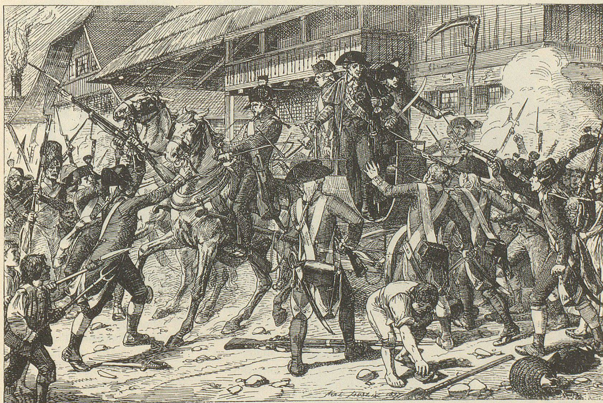
Schultheiss Steiger von Bern im Gefecht von Grauholz am 5. März 1798

Mit eindeutiger, unmissverständlicher Mimik sind die Personen dargestellt, und in sehr verständlicher Weise schildern sie historische und andere Ereignisse. Bei genauer Hinsicht lassen sich allerlei Details in unerhörtem Perfektionismus erkennen. Beispiele der unzähligen Illustrationen, die Jauslin für nicht weniger als zwölf Kalender schuf, sind hier im Bilde wiedergegeben und mögen hierfür den Beweis erbringen. Etwa 400 erhaltene Bleistiftskizzen für Kalender-Illustrationen vermitteln einen Einblick in die immense Schaffensweise dieses begnadeten Künstlers. Wenn man bedenkt, dass er ungefähr ein Jahr vor dem Erscheinen des jeweiligen Ka-