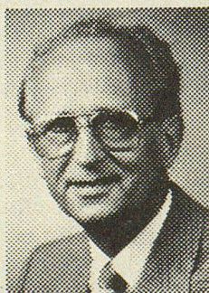
Frehner AG Herisau

Polster- und Lederpolstermöbel ★ Wohn- und Esszimmer Schlafzimmer und Studios ★ Wohnwände und Buffets Elementschränke und Betten ★ Tische, Stühle und Salontische ★ Komplette Aussteuern und Einzelmöbel!