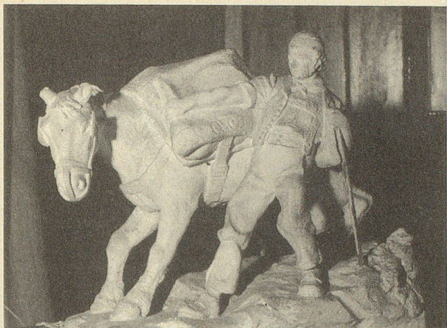
Ein kleines Kunstwerk im Modell (Säumer mit Säumtier).