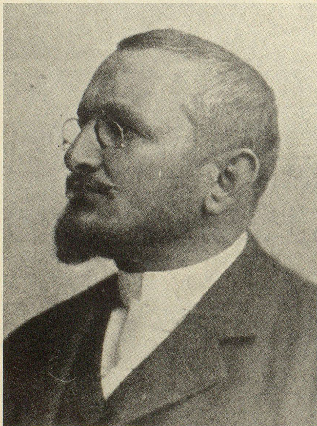
Ein Porträt von Bildhauer August Bösch.

August Bösch war es wegen eines sich bereits im frühen Knabenalter einstellenden Gehörschadens versagt, die Elementarschule an seinem Heimorte zu durchlaufen, sondern musste in die Taubstummenganstalt in St. Gallen eintreten. Die genossenen Privatstunden befähigten ihn sogar, einwandfrei vom Munde abzulesen, so dass er nach Absolvierung einer Steinhauerlehre in der Limmatstadt, wo er auch Unterricht im Zeichnen und Modellieren