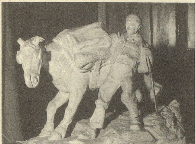
Ein kleines Kunstwerk im Modell (Säumer mit Säumtier).