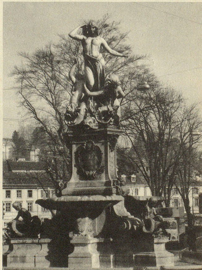
Der aus dem Jahre 1897 stammende Broderbrunnen beim Börsenplatz.