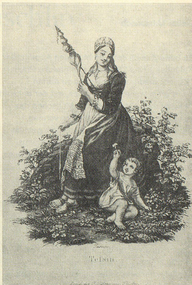
Tessiner Spinnerin aus der guten alten Zeit

«Und Bertha, die die Spindel auch geführt, Sogar zu Pferd, verschwindet in der Ferne, Erreicht bald ihr Königsschloss Payerne.»