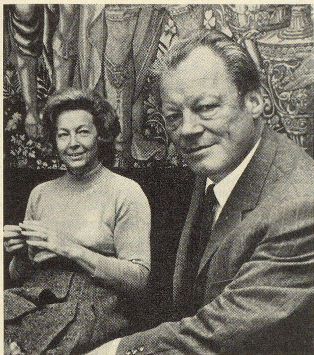
Der zurückgetretene Bundeskanzler Willy Brandt (BR Deutschland) mit seiner Gattin Rut