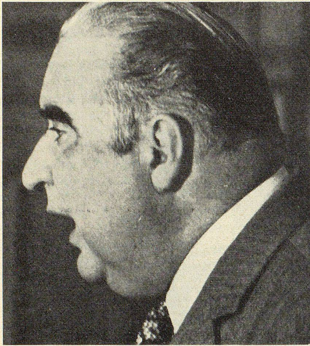
Der verstorbene französische Ministerpräsident Georges Pompidou

Volk bestätigen zu lassen. Seine Partei erlitt aber eine schwere Niederlage, und Labour-Führer Harold Wilson bildete eine zerbrechliche Minderheitsregierung. — Unstabil blieb die Lage auch in Italien, wo die Christdemokraten mit der Bestätigung der zivilen Ehescheidung durch das Volk eine Schlappe einstecken mussten. — Selbst in der Bundesrepublik Deutschland kam es zu einer unerwarteten Krise, als eine düstere Spionageaffäre zugunsten der DDR platzte. Bundeskanzler Willy Brandt sah sich veranlasst, zurückzutreten. Nachfolger wurde am 16. Mai 1974 sein SPD-Kollege Helmut Schmidt. Außenminister Walter Scheel rückte in das Amt des Bundespräsidenten auf, nachdem Gustav Heinemann auf eine weitere Amtsperiode verzichtet hatte. — Eine unerwartete Wendung trat auch in Frankreich ein: Am 2. April 1974 starb Präsident Georges Pompidou im Alter von 62 Jahren. Als zweiter Präsident der V. Republik hatte er 1969 de Gaulles Nachfolge angetreten. Nach einem spannen-