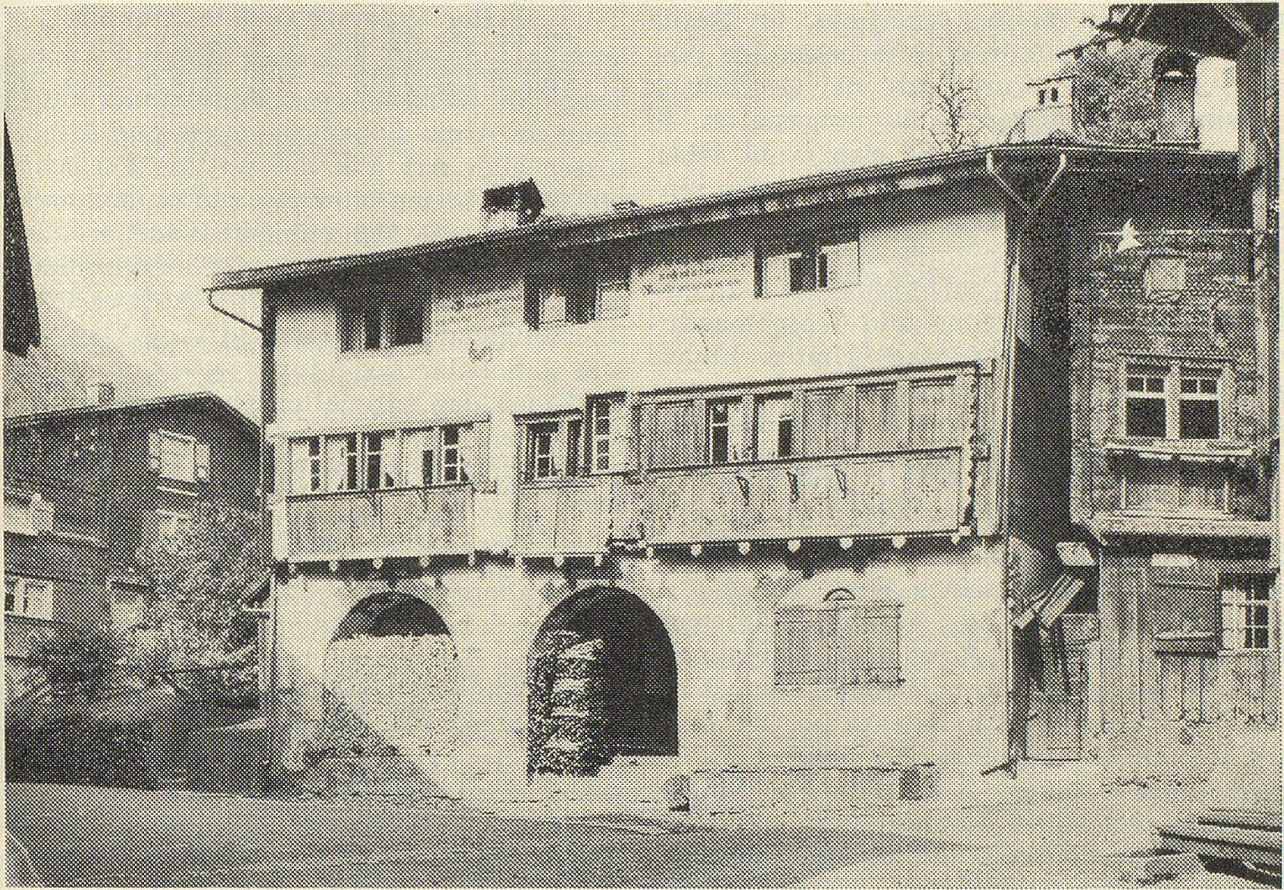
Das Montaschinerhaus in Werdenberg, wie es sich heute nach der sorgfältigen Restaurierung präsentiert (links) und wie es zuvor aussah (oben).

hölzernen Bauteile müssen innen und außen fachgerecht konserviert werden.