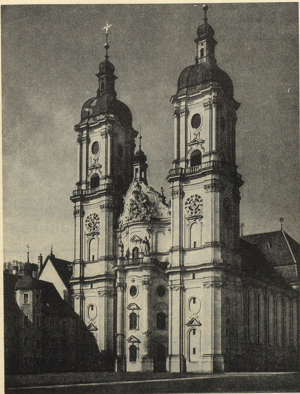
Die Ostfassade der St.Galler Kathedrale