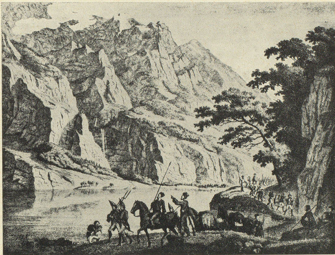
Suworoffs Truppen dringen durchs Klöntal nach Glarus vor

Milieuwechsel den Kindern selbst einen unschätzbaren Dienst zu erweisen, die bedrängten Familien zu entlasten und Leute für die Hilfe herbeizuziehen, die zwar über wenig Geld verfügten, indessen gerne bereit waren, das ihrige zur Linderung der Not beizutragen. Es war eine viel dankbarere Unterstützungsform als ein bloßes Almosen, und überdies hoffte mancher Wohltäter, in einem Auswandererkind eine Arbeitskraft für Haus und Feld oder wohl auch für seine Werkstatt zu gewinnen.