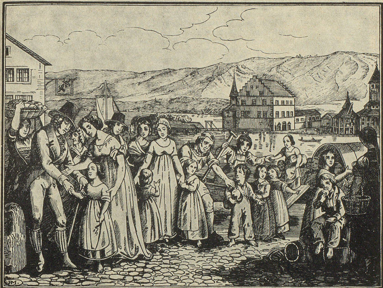
Die Glarner Kinder.