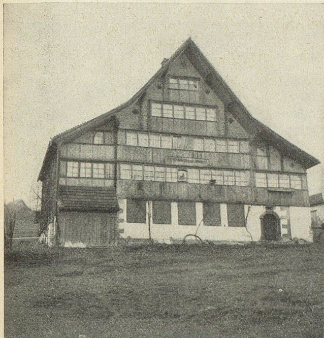
Das «Gemsli» mit seiner imposanten Frontansicht. An der Hauswand und im kleinen Rebberg links gedeiht das seltene Tröpfchen.